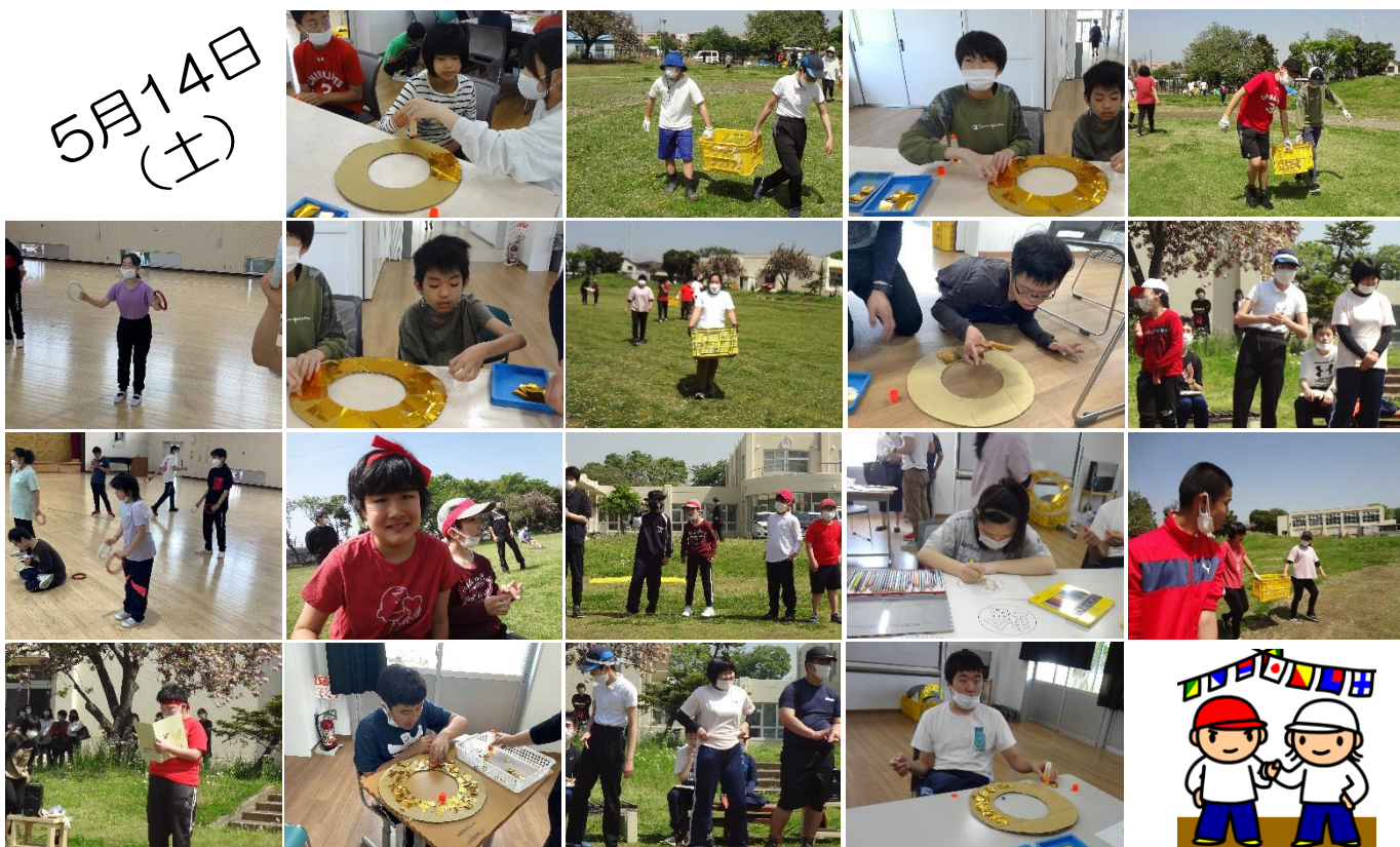
運動会集会、テント用の土のう準備、勝ち星制作、パフォーマンス練習の様子